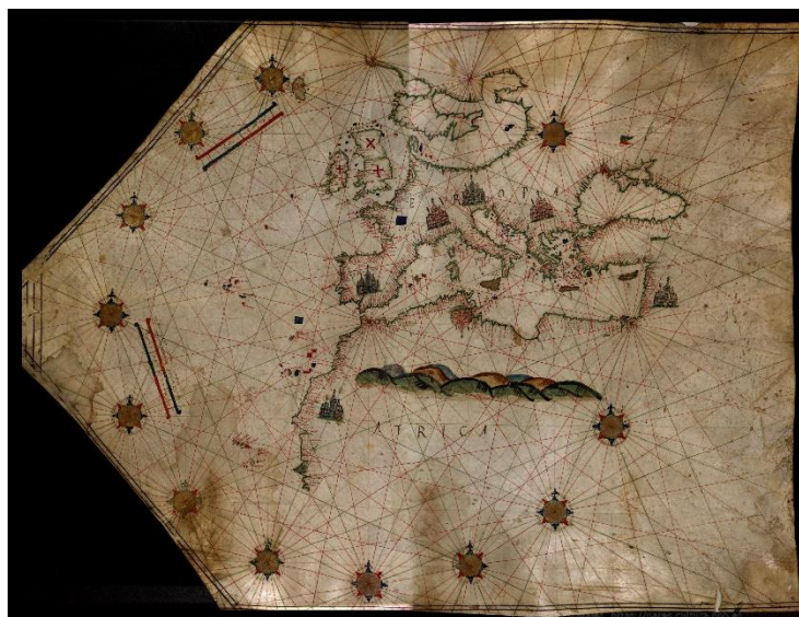
Figura.1. Carta portulano del Mediterráneo y de las costas atlánticas de Europa y África