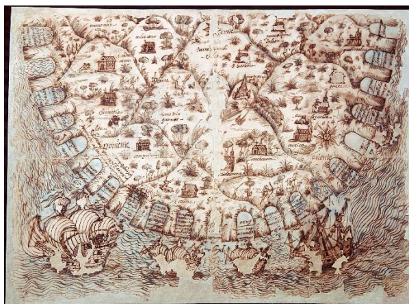
Figura 4. Mapa de la Costa occidental de Nueva España.