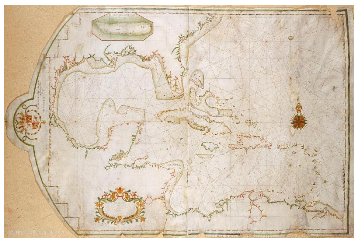
Figura 2: Carta náutica de las costas de Tierra Firme, de América Septentrional, Islas de Barlovento y seno Mexicano.

autor realizada en 1745 se custodia en el Museo Naval de Madrid. 10 Estas cartas náuticas, que reflejan la pervivencia de la técnica del portulano hasta el siglo XVIII, reflejan información de contexto que podría complementar al que se conserva en el Archivo General de Indias.