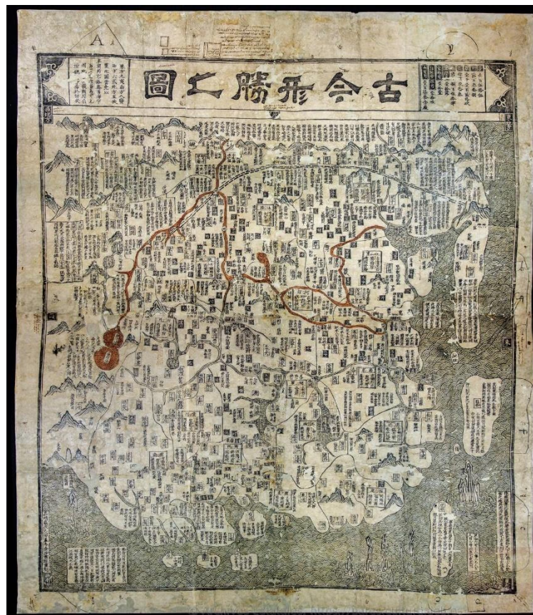
Figura 3. Mapa Topográfico moderno y antiguo [de la China]