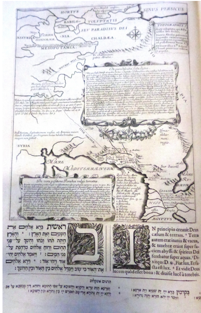
Biblia hebraica, samaritana, chaldaica, graeca, syriaca, latina, arabica...BPNM 1-1-2-1