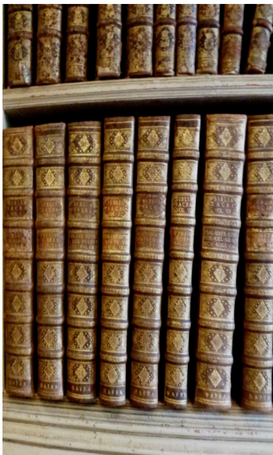
Pormenor Estante Relativa a Biblias