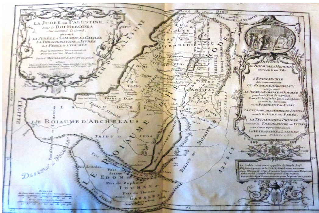
Livres apocryphes de l'ancien testament... BPNM 1-1-7-4