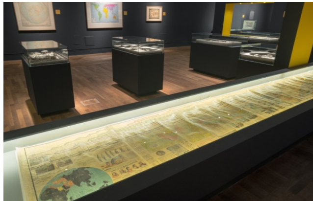
Figura 4. Exposición "Cartografías de los desconocido"

Además, edita estudios sobre sus propios fondos y los catálogos de las exposiciones que se exhiben en sus salas, tal es el caso de la Carta sincronológica que se muestra en el catálogo de la exposición "Cartografías de lo desconocido", exposición celebrada en la BNE entre noviembre de 2017 y enero de 2018.